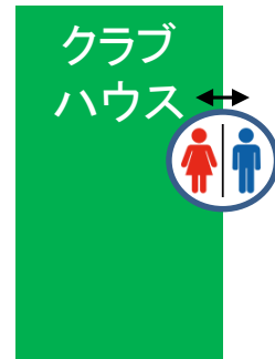
※U-8交流戦コート配置図